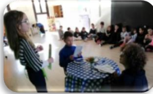
SCRIPTS ANG ROLE PLAYS Interpretem personatges i situacions diverses