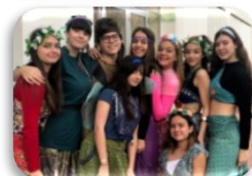
TRINITY THEATRE COMPETITION Participem en concursos