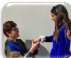
SHAKESPEARE Coneixem autors anglesos