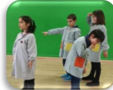
TABLEAU Descrivim escenes estàtiques