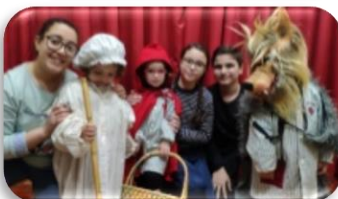
PLAYS 4 KIDS Representem contes per als més petits