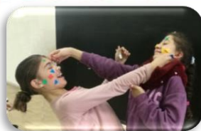
GAMES Aprenem fent anglès